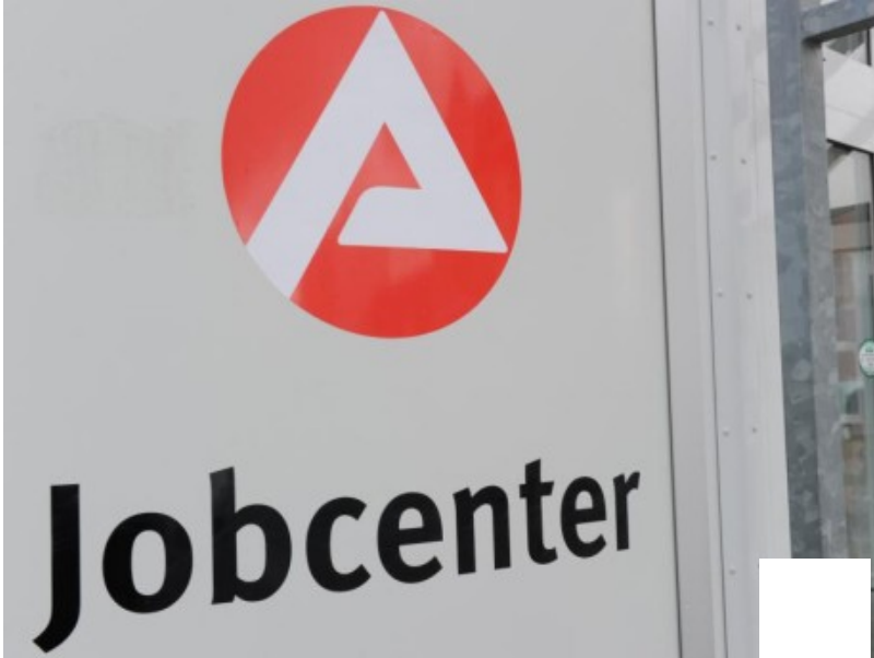
Ein Mann randalierte im Jobcenter.

BONN. Zu einer heftigen Auseinandersetzung kam es am Dienstagmorgen im Jobcenter an der Rochusstraße in Bonn-Duisdorf.