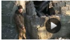
Wunder von Donezk: Oma rettet Enkeltochter