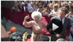
Exzentrische Herzogin von Alba ist tot